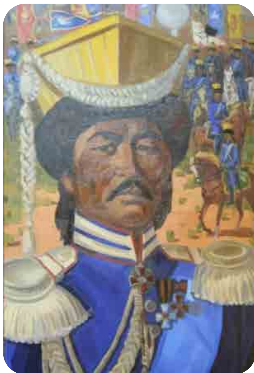
Серебджаб (Сереб-Джап) Тюмень (1774–1858)

Калмыцкий князь, нойон Хошеутовского улуса.