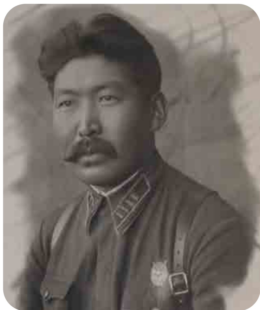
Басан Бадьминович Городовиков (1910–1983)